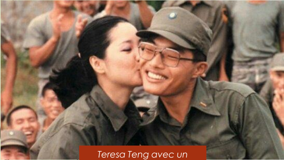
Teresa Teng avec un soldat de Taiwan (années 1970)

Durant sa carrière, Teng était connue comme la « Chérie du soldat », avec ses nombreux spectacles pour les soldats, et en étant un enfant d'une famille militaire. Elle a fait aussi plusieurs concerts pour la charité.