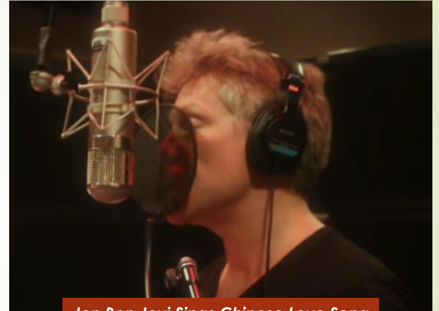
Jon Bon Jovi Sings Chinese Love Song for Valentine's Day in China – Youtube, 20 Aout 2015