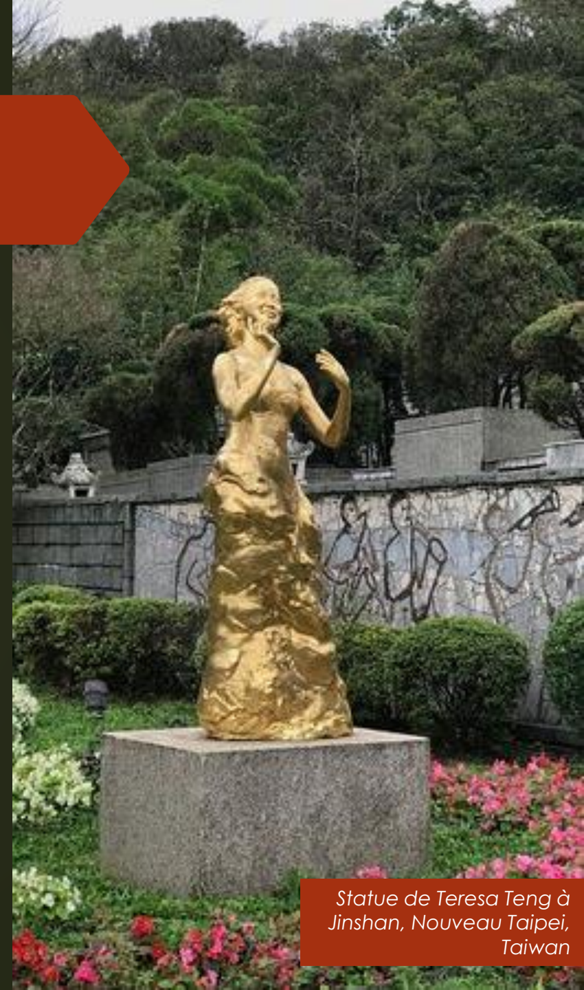
Statue de Teresa Teng à Jinshan, Nouveau Taipei, Taiwan